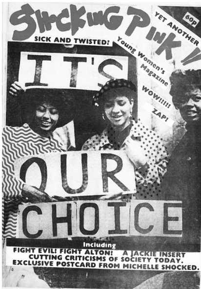
Сл. 3 Пример зина са Pinteresta 20