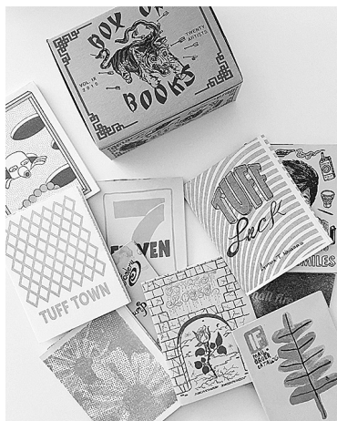
Сл. 1 Разноликост облика зина

обичном папиру са насловницом коју красе разни колажи. 15 На интернету се могу пронаћи мустре за самосталну израду дигиталних зина (нпр. Envato Elements, Flipsnack, Fliphtml5 итд.), идеје на Pinterest-у 16 и туторијали на YouTube каналу. 17