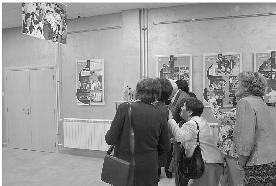
Поглед на матурско вече са носталгијом – са отварања изложбе

Кроз трећи сегмент изложбе приказани су видео-записи суграђана који су током Дана прикупљања сећања испричали занимљивости о Дому ЈНА и прикупљене фотографије, што је привукло велику пажњу присутних на отварању изложбе.