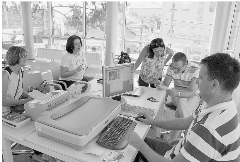
Кад потомци прегледају породичне албуме – Дан прикупљања сећања

Локални и регионални медији су Дан прикупљања сећања на Дом ЈНА и забаву у Чачку најавили и пратили снимљеним прилозима и изјавама учесника, а Библиотека је искористила прилику да јавности скрене пажњу на себе као место новог генерацијског сусретања, повезивања и дељења успомена, као и на предстојећи програм намењен широј друштвеној заједници.