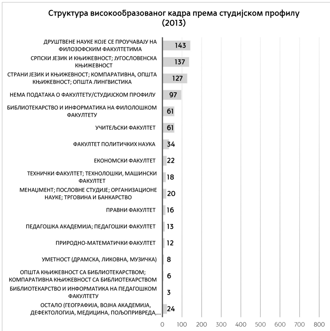
Графички приказ бр. 3

Још једну од бројнијих група чине запослени са дипломом учитељског факултета, којих има 72 или 9,29%. Остале категорије имају далеко мање представника, међутим, није занемарљив ни проценат запослених са Факултетом политичких наука и из области менаџмента (4,39%). Постоји и одређени број економиста, правника, па чак и понеко из сфере природних наука, уметности, машинства, пољопривреде и других.