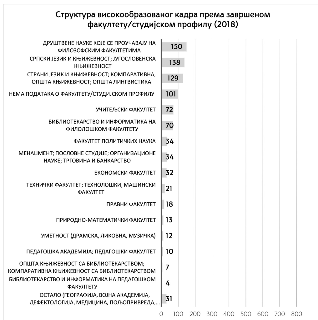
Графички приказ бр. 4

пута и то обухвата „прање врата, прозора, радијатора, сијалица и зидова“, али зато не могу да препоруче колико би библиотекара са дипломом стеченом на студијама библиотечно-информационих наука, или колико професора језика и књижевности требало да има у колективу, у односу на одређен обим фонда или број становника насељеног места. 18 Систематизација радних места у српским библиотекама такође ретко прецизира потребан студијски програм за позицију библиотекара. 19 Понавља се само оно што пише у Закону.